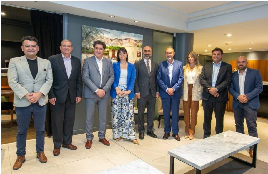
En la reunión de ministros de Producción de Cuyo y autoridades de la Cámara de Comercio de EEUU se analizó que haya una sede en esta región.

Entre las acciones realizadas para potenciar las ventas al exterior, en octubre pasado en Mendoza, fue organizado un encuentro de ministros de Producción de Cuyo y autoridades de la Cámara de Comercio de los Estados Unidos (AmCHam), con la finalidad de exportar productos y servicios a ese país